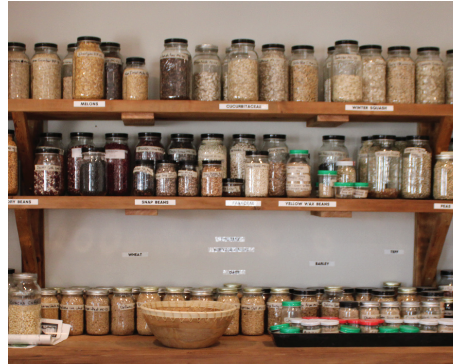
seed shelf by MASA Seed Foundation.