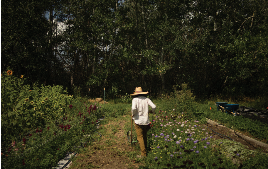
Artemis Flower Farm.