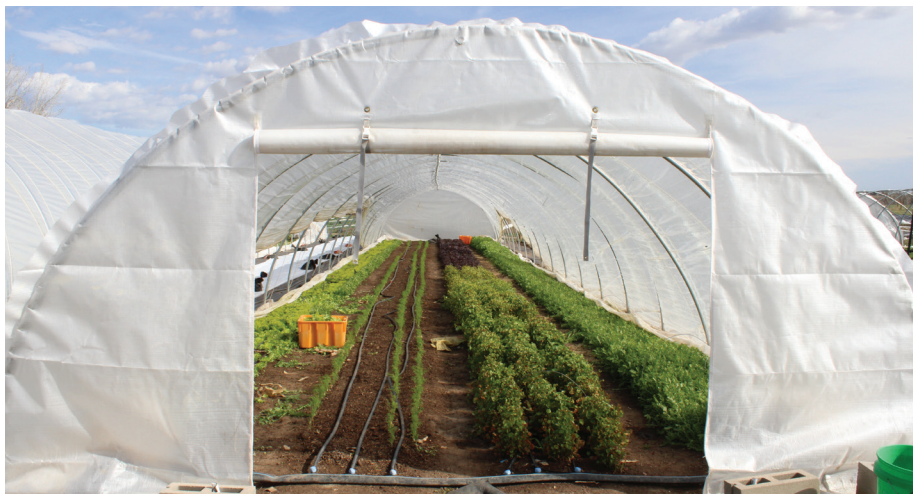
Hoophouse Esoterra Culinary Garden.

—Jaime Kopke, curador principal invitado