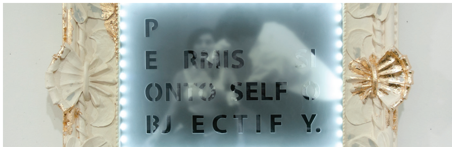
Arriba: Nyeema Morgan, Soft Power, Hard Margins . (1964) (detalle), 2020, técnica mixta. Cortesía de la artista. Imagen de la portada: Nyeema Morgan, The Flower (detalle), 2020, técnica digital. Cortesía de la artista.

*Invitamos al público a llevarse una hoja de papel periódico de la exposición. Rogamos no llevarse más de una hoja por persona y no volver a colocar las copias después de tocarlas. Si es necesario, podrá reciclar su hoja en la recepción.