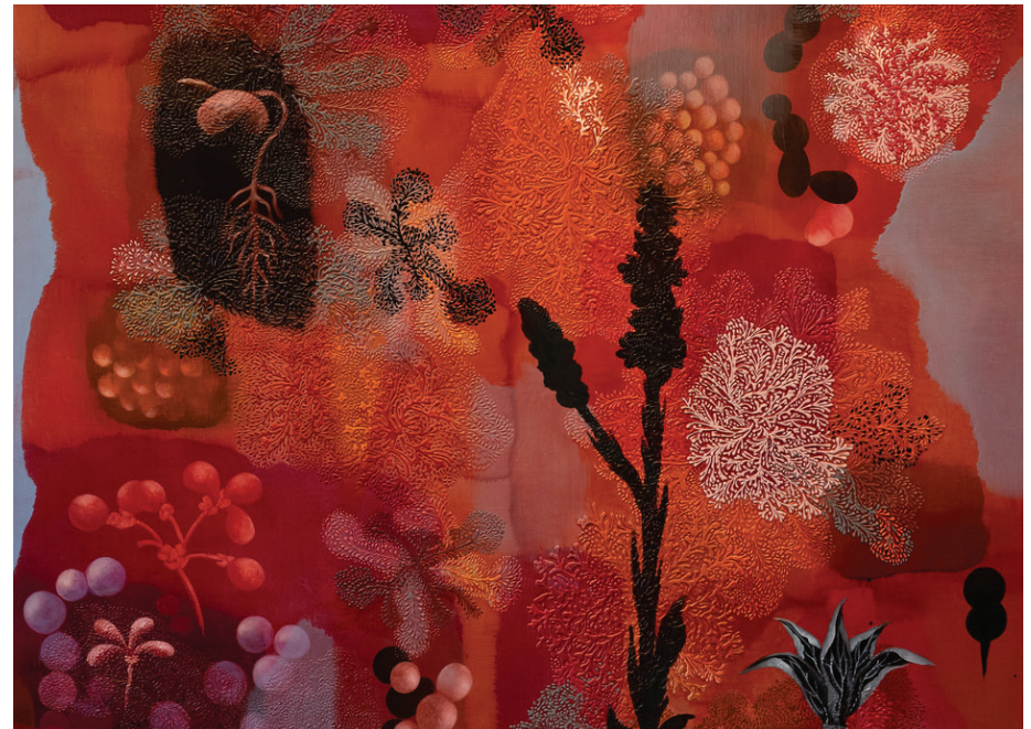
Arriba: Jody Guralnick, Noetics (detalle), 2022, óleo y acrílico sobre panel. 54 x 60". Imagen cortesía de la artista.

Imagen de la portada: Jody Guralnick, sonoluminescence (detalle), 2023, óleo y acrílico sobre panel. 49 x 36". Imagen cortesía de la artista.