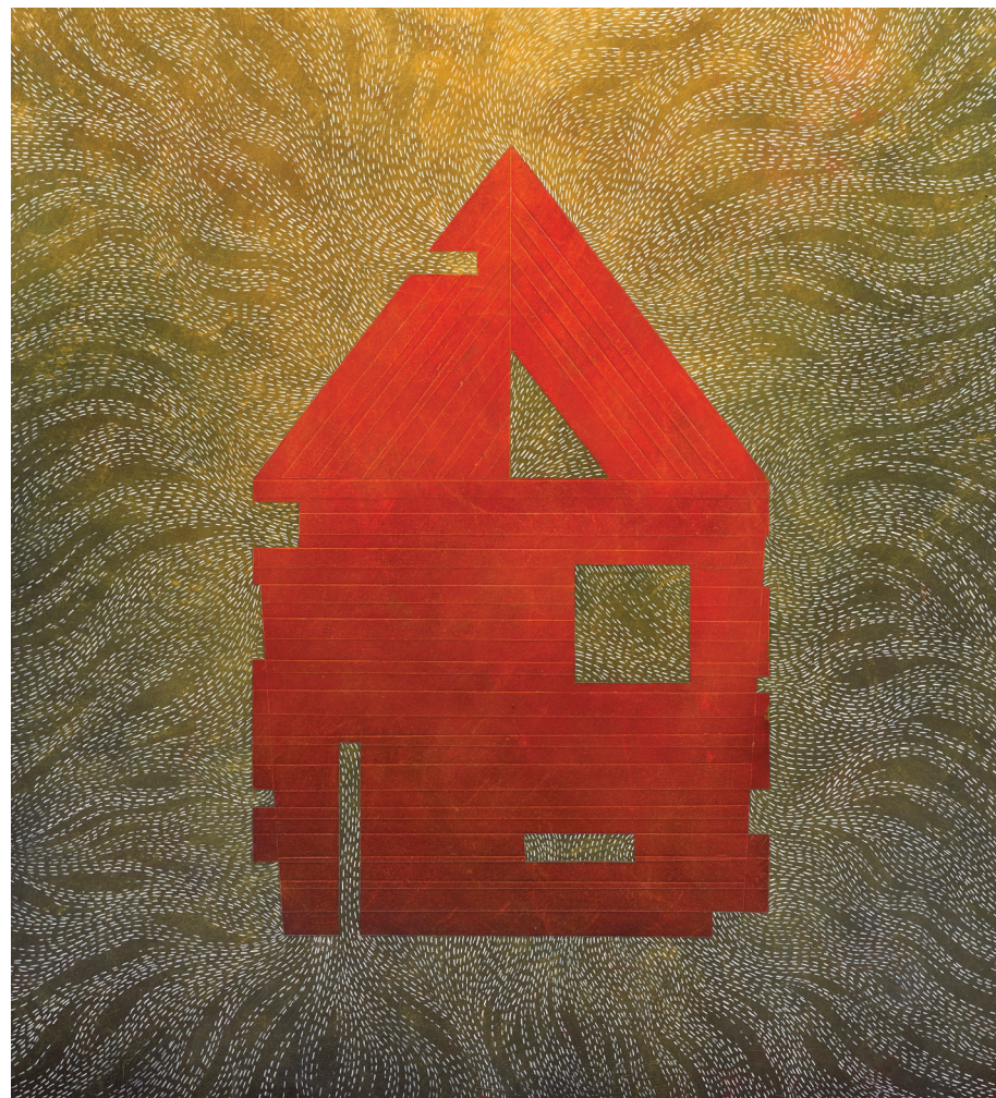
Arriba: Richard Carter, ERRATIC STRUCTURE (detalle), 2017, materiales mixtos sobre panel. 36 x 36". Imagen cortesía del artista.

Imagen de la portada: Richard Carter, FOSSIL BED I (detalle), 2021, materiales mixtos. 30 x 32". Imagen cortesía del artista.